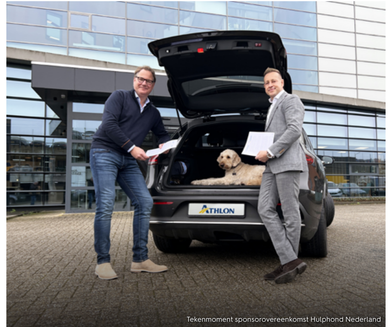
Tekemoment sponsorovereenkomst Hulphond Nederland

De oorlog in Oekraïne houdt ons allemaal bezig en veel collega's willen iets doen. Daarom heeft elke Athlon medewerker 3 extra vrije dagen voor vrijwilligerswerk voor Oekraïne gekregen. Deze uren zijn op verschillende manieren ingezet. Zoals het rijden van vluchtelingen die niet beschikken over vervoer, helpen in het crisiscentrum in de Jaarbeurs Utrecht en het inrichten van vluchtelingenlocaties. De Athlon Groep doneerde, ook namens Athlon Nederland, € 50.000 aan de inzamelingsactie Giro 555.